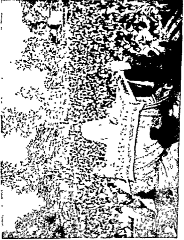
सोढोदेवरा (विहार) जयप्रकाशजीच्या आश्रमालील जाहीर सना